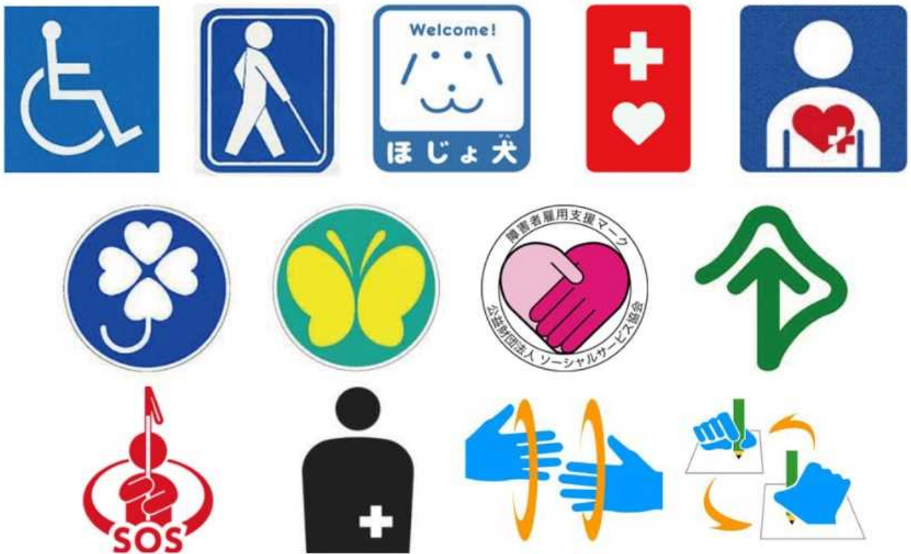
障害者に関するマーク