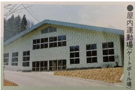
●屋内運動場(ゲートボール場)