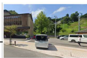
三春町役場駐車場