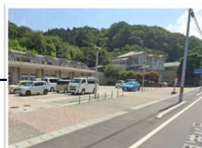
保健センター駐車場