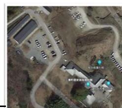
歴史民俗資料館 駐車場