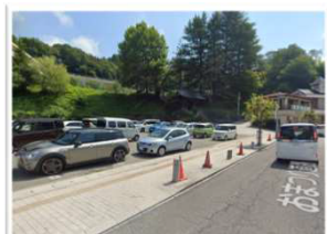
三春小学校下駐車場