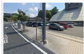
まほら付属駐車場