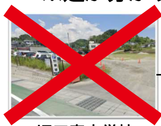
旧三春中学校 駐車場