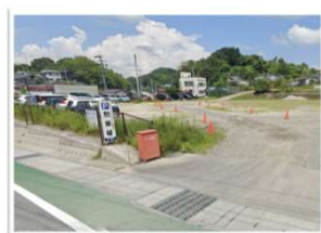
旧三春中学校 駐車場