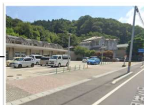
保健センター 駐車場