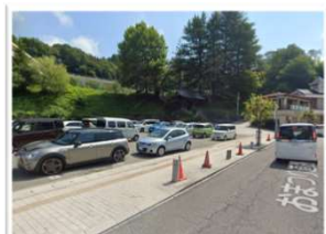
三春小学校下 駐車場