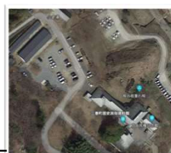
歴史民俗資料館 駐車場