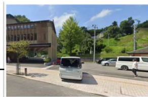
三春町役場 駐車場