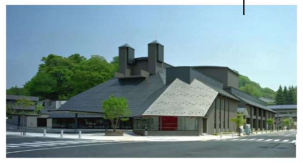
会場:まほらホール