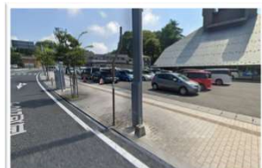
まほら 付属駐車場