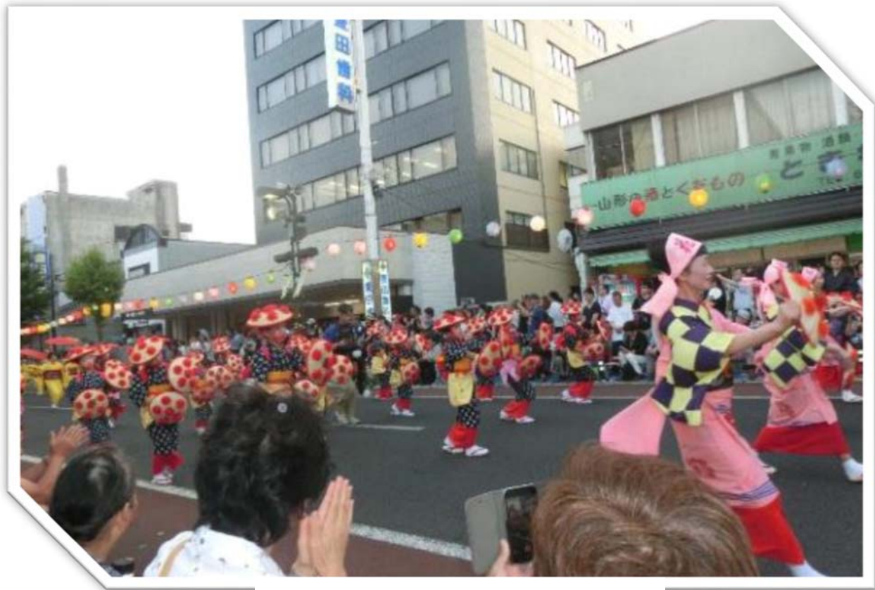
山形花笠まつり観覧(2017,8,7 七日町通り)