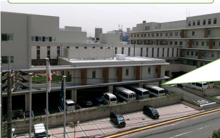
広島市児童相談所及びこども療育センター等建物全景