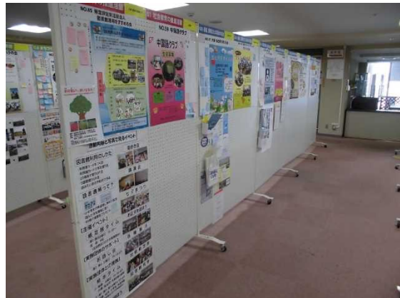
勢揃いした 100 枚のポスターは圧巻です