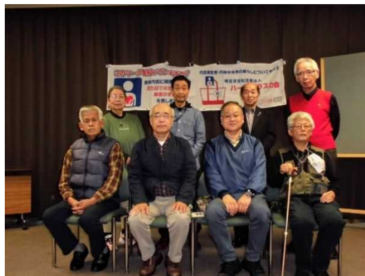
参加者の記念撮影

全ての議案は、出席者総員の賛成多数で承認可決しました。総会終了後は参加者各人から持ち寄ったお土産をおやつにしながら、交流会を開催し、活発な意見交換が出来ました。