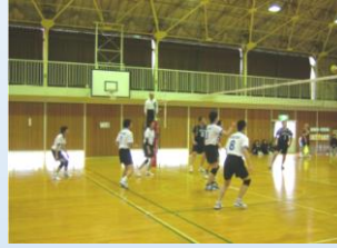
バレーボール競技