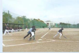
ソフトボール競技