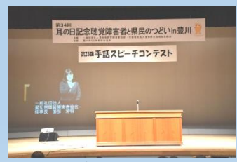
手話スピーチコンテスト