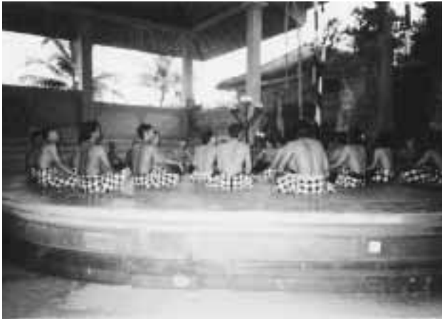
叫び続ける青年たち

「ケチャ、ケチャ」 と、叫んでいる。この光景は、バリーを代表する芸能の一つで、別名モンキーダンスと呼ばれるそうだ。この《男性たちのリズムカルなコーラスは、そもそもサンヒャン・ドウダリという儀礼舞踊の中で、踊り子をトランス（催眠）状態に導くために唄われ、外部の人間には見ることでできない秘儀》だと日本語の説明書に書いてある。たいまつの炎の中、幾重にも折り重なる声、男達が震わす腕のシルエットは、原始の記憶を呼び起こすような気合いと迫力に満ちていた。観客の視線の多くが、汗まみれになった青年たちの背中に近づいたのは確かだ。私は他の観衆を思いやることは一切忘れてしまったほど興奮した。いつのまにか 「ケチャ、ケチャ」「ケチャ、ケチャ」 「ケチャ、ケチャ」「……………」 と、限りなく続く声に魅了されていた。いつのまにやら、大口を開け青年たちと一緒に叫んでいた。こんな車いすユ-