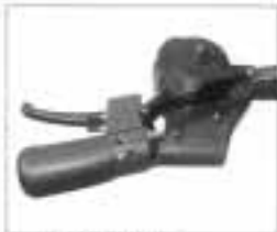
オートスピーコンII