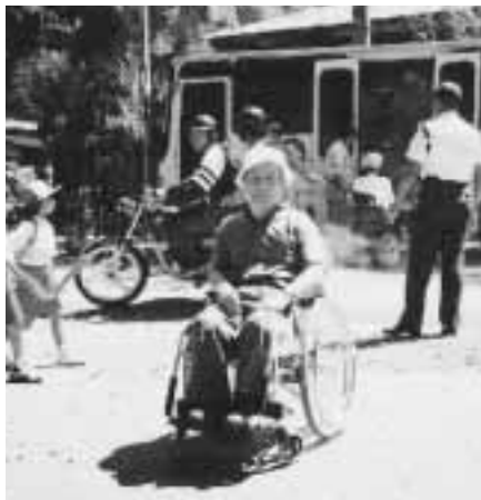
貧弱なりフトバスと左奥の賭博場

会場の出口で、原住民達が賭博(トランプ使用)らしきものを開場していた。恐る恐る近づいていった私に、手まねきして仲間入りを呼びかけている。「スラムツ・シアン(今日は)」