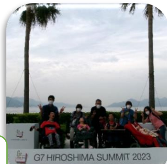
G7 HIROSHIMA SUMMIT 2023