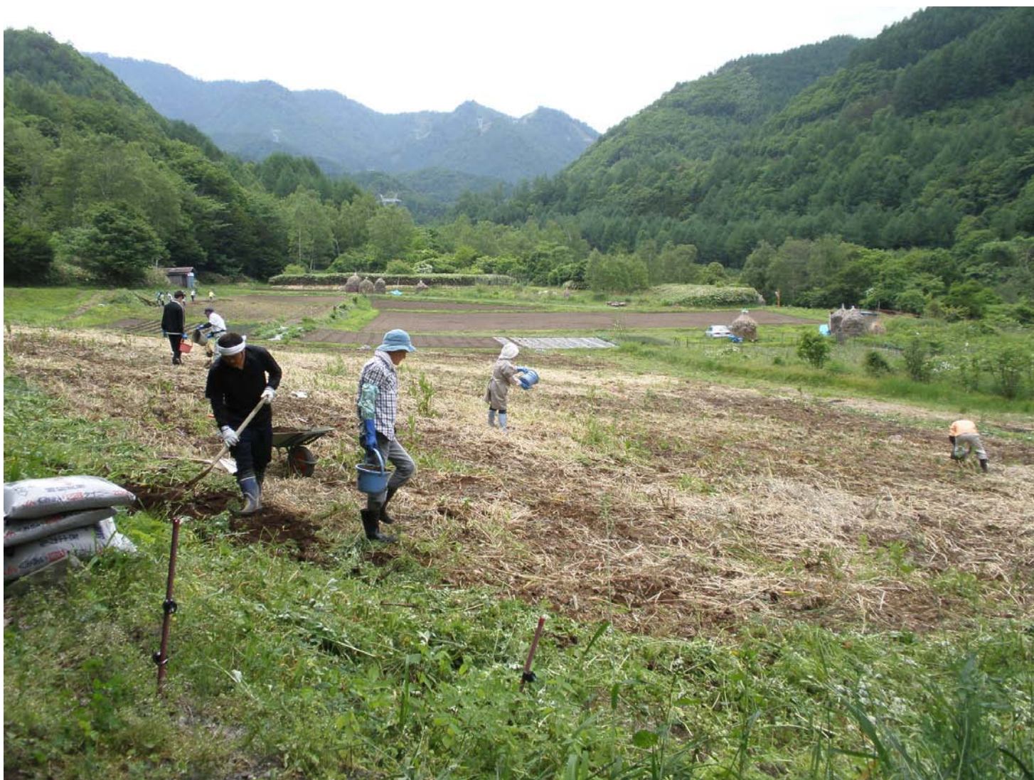
松本市奈川地区：上質なそばの故郷