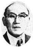
社会福祉法人 秋田県身体障害者福祉協会