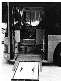
手動スロープ (前扉)

○利用申込先(問い合わせ) 秋田市新屋下川原町二一三 秋田県障害者相談センター 電話 ○一八一八二三一六三七 FAX ○一八一八六三一四三七七