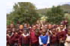
スワジランドの小中学校の子どもたち (JICAインクルーシブ教育無償資金協力準備調査)