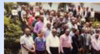
モザンビーク国家道路庁(ANE)の皆さんとの記念撮影 (JICA 円借款実施促進業務)