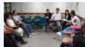
地雷に被災しリハビリに励む方々から話を伺う (JICAコロンビア平和構築プログラム評価調査)

技術協力や有償及び無償資金協力案件の調査サービスです。専門手法・ツールによる調査と協議支援を行います。案件形成時の課題分析ワークショップのモデレーションや実施フェーズの効果測定やインパクト評価では、PMBOK®やPCMやPRAなど国際的に認定された手法によるサービスを提供します。