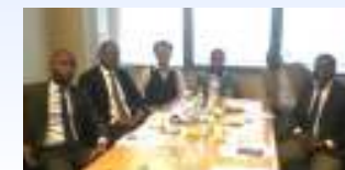
モザンビーク中央銀行職員への能力強化セミナー (JICA 円借款実施促進業務)

米国PMIのPMBOK®による研修講師を務めて、クライアント政府関係者が担う投資事業のマネジメントや調達業務技術の能力強化を図ります。(独)国際協力機構(JICA)による政府開発援助(ODA)調達ガイドラインと国際コンサルティング・エンジニア連盟(FIDIC)調達マニュアル双方の知識共有と実践技術の指導・助言なども行います。