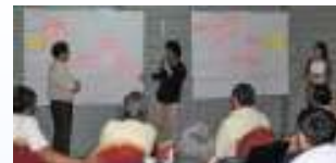
ラオスでの教育政策・戦略策定ワークショップ (ADB 中等教育開発プログラム)