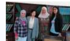
ヨルダンの障害者就労支援NGOとの会合 (JICA障害者就労支援技術協力事前調査)