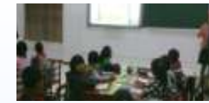
震災後に再建された小学校と子どもたち (JICA四川大地震復興支援技術協力評価調査)