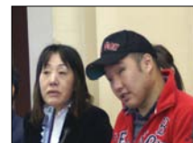
元気いっぱい！兵庫の原告団