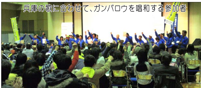
兵庫の歌に合わせて、ガンバロウを唱和する参加者

11月29日(日)、「とどけ原告の声! なくせ障害者自立支援法! ~障害者自立支援法訴訟の勝利をめざす近畿ブロック集会~」が、大阪ヒューマインドで開催されました。近畿各府県の原告・弁護士・めざす会から350名を超える人たちが、兵庫からは約80名が参加しました。