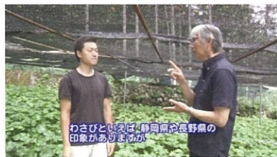
それいけ! くいしんぼ ~真妻わさびの発祥の地を訪ねて~ 和歌山県聴覚障害者情報センター