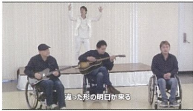
4Disabilities promotion video ケー プランニング K Pranning(大阪府)