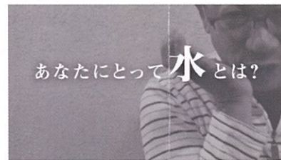
水と大阪 大阪ろうあ会館