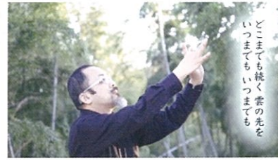
ゆうあい 聴結び(兵庫県)