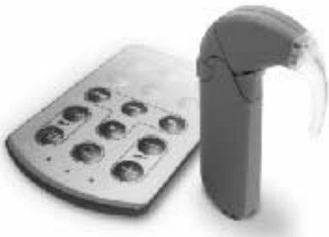
▲人工内耳 スピーチプロセッサ

人工内耳は補聴器でも音を聞くことができない重度の難聴者にとって「音のない世界から音のある世界へ」の大きな福音となっています。しかし人工内耳は手術をするだけでなく聞こえるものではなく、適切な指導訓練が重要です。また、より良い聞こえのために、正しい知識をもつことも大切です。