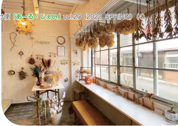
色々なドライフラワーが楽しめるカフェスペースは、近所の方の憩いの場所にもなっています。

東寺南門より南へ向かう道を下り一筋目を東に、昭和頃の建物が並ぶ住宅街に、間口が白い建物があります。東寺さんと南区役所との中間あたりに、国道から一筋入っただけで、車の喧嘩もなく静かな街並み。馴染みよく落ち着いた様子を見せながら「chapter」はあります。外から揺らぎの有るガラスを使用した窓