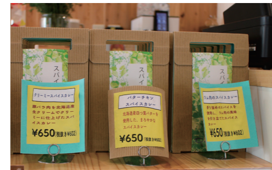
レトルトカレー3種類。それぞれ、個性的な美味しさです。全部楽しみたい方は、お得な3種セットがおすすめ。

個人的なカレーがたくさんあり、迷ってしまう方は、あいがけカレーがおすすめ。特に「Doppo」さんでは、2種盛り・3種盛りだけでなく、他店ではあまり見かけないスパイスカレー4種盛りがおすすめ。一度に4種類の味が楽しめる贅沢なカレーは、少しずつ盛られていて、それぞれの違いを楽しむことができる、お得なメニューです。 古代米とインディカ米の2種類のご飯があり、ご飯大盛り(+100)やご飯とカレー両方大盛り