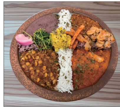
おすすめの4種盛りカレー。こだわりの色々なカレーが一度に味わえるお得メニュー。

1月22日は「カレー記念日」。1985年の1月22日に学校給食で全国の小中学校にカレーの提供が呼びかけられた日にちなみ、制定された記念日だそうです。国民食になったカレーですが、最近京都ではスパイスカレーのお店が急増中。お店ごとに独自にブレンドされたスパイスが楽しめるため、いろいろなお店を巡るファンも多くいます。独特の辛さと甘さ、コクのある深い味わいや、クセになるスパイスなどの特徴があるなかで、今回は、南区にあるスパイスカレーのお店を紹介いたします。