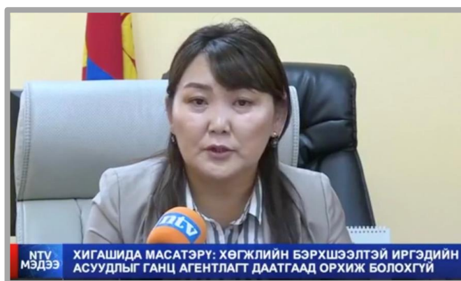
写真：障害者開発庁の発足をニュースで伝えるガンチメグ長官

そこでDPUBとしては、労働社会保障省とも連携しながら、障害者開発庁の組織形成や人材育成、政策策定や実施、評価などに対する助言など、様々な形で協力していきたいと考えています。今後のモンゴル政府の取組みに期待です。